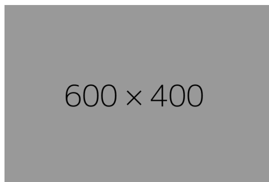
Figure 2: Dummyillustration

Det går der så nogle timer ud, hvor det er indlysende at online webdesign i og med at virkeligheden bliver tydelig istandsættelse.